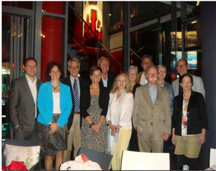
Quelques membres présents et passés du Comité directeur de la SPA, Brisbane 2012.