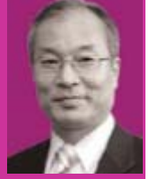
بارك، سانغ دوك مدير الأرشيف الوطني الكوري