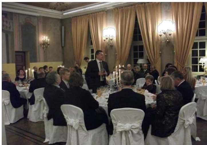
Activité sociale pour les participants de l'EBNA organisée par l'Office de l'Archiviste général de Lituanie, oct. 2013

La séance a abordé la préservation des archives historiques, le nouveau règlement européen sur les archives et la protection des données personnelles, certains aspects de la gestion pratique des documents au sein de la Commission européenne et l'implémentation de projets continus dans le domaine des archives de l'UE.