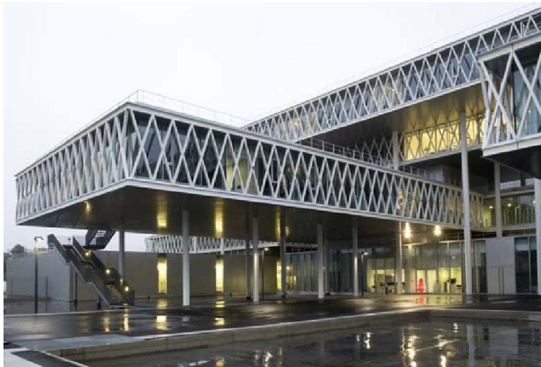
Partie du bâtiment des Archives Nationales à Pierrefitte-sur-Seine

retenu en mai 2005. C'est finalement le 11 février 2013 que le bâtiment, ouvert au public depuis le 21 janvier, est inauguré par M. François Hollande, président de la République.