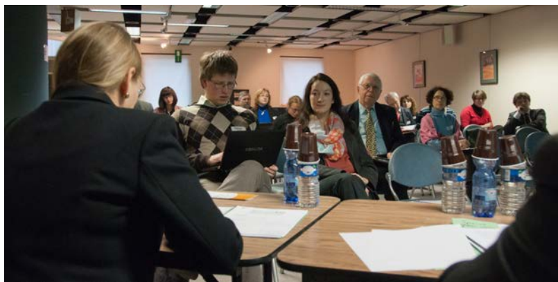
Réunion APEX-EURBICA à Bruxelles