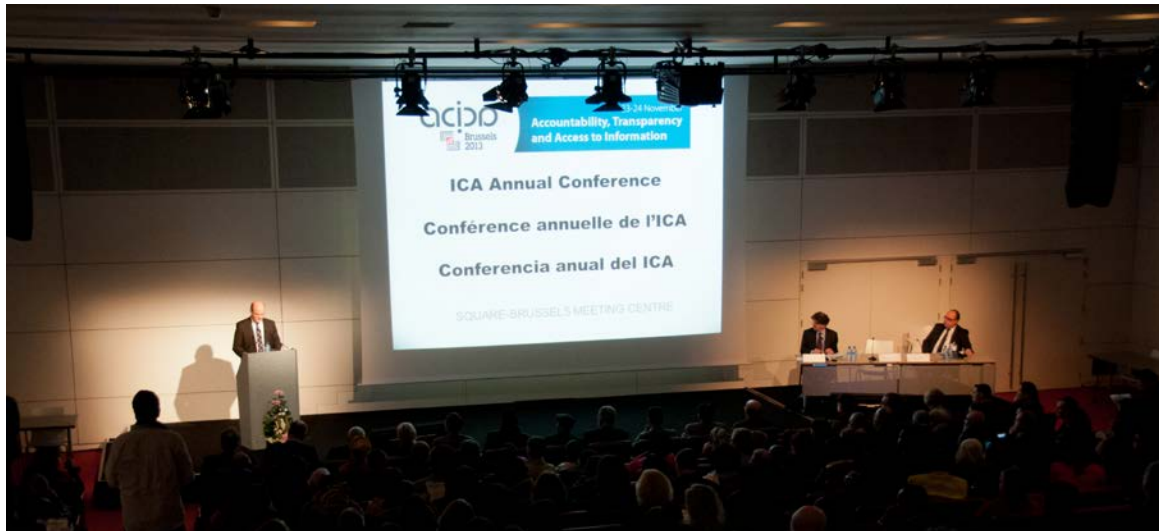
Conférence annuelle de l'ICA sur le thème "Responsabilité, Transparence et Accès à l'Information", Bruxelles, 2013