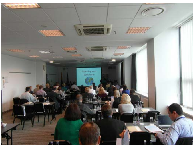
Réunion du DLM Forum meeting, Vilnius, 10-11 octobre, 2013

La réunion et la conférence du Document Life Cycle Management (DLM) ont eu lieu les 10 et 11 octobre 2013 au Centre de conférence du Life Radisson Blue Hotel Lietuva à Vilnius. En effet, la réunion et la conférence sont organisées semestriellement dans le pays qui préside le Conseil de l'UE. Les présentations de la première journée de la réunion ont traité des problèmes liés à la société de l'information et des moyens pour les résoudre, de l'avancement des projets en cours d'implémentation (E-ark et EU Wiki) ainsi que d'initiatives nouvelles.