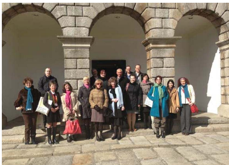
Les participants de la réunion des Chefs de la Conservation, 4 avril 2013 à Dublin.

moisissures ainsi que sur la recherche et les solutions en vue de les combattre. Pendant la journée, des visites aux Archives nationales d'Irlande et au département de la bibliothèque du Trinity College étaient également prévues.