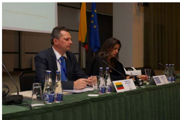
La 28 e Conférence de l'EBNA à Vilnius