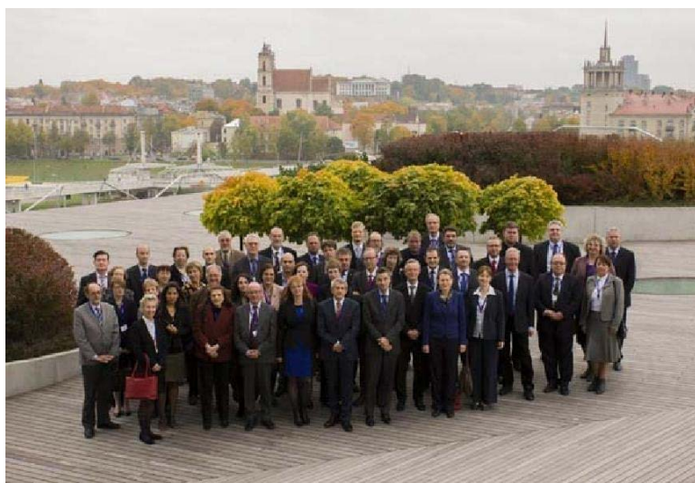
Participants de la réunion EBNA/EAG à Vilnius, octobre 2013