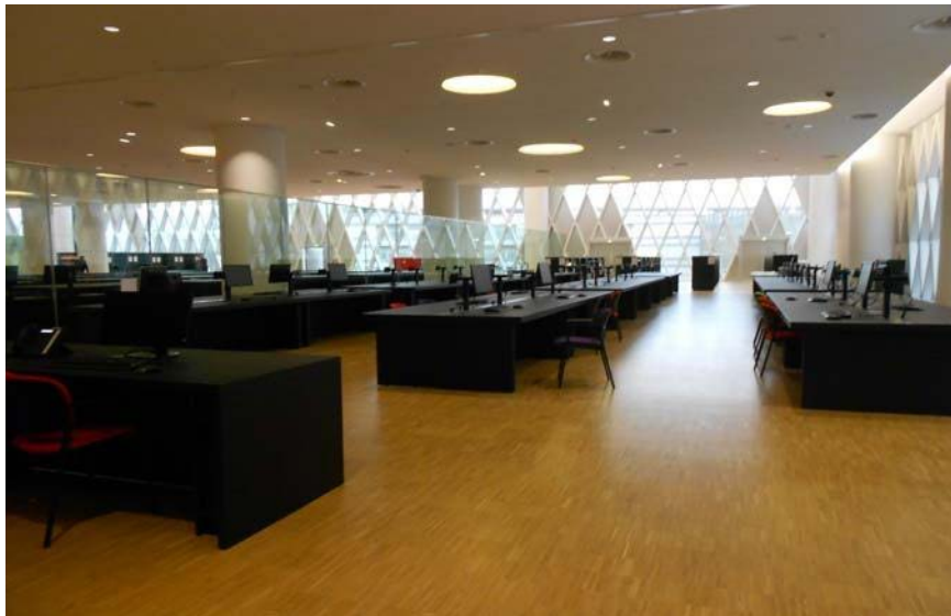
La salle de lecture du nouveau site à Paris

Le bâtiment administratif et d'accueil au public (espaces d'exposition, espaces pédagogiques, auditorium salles d'études et de réunions) se compose de 10 "satellites", largement vitrés, superposés ou reliés entre eux par des passerelles en verre et aluminium.