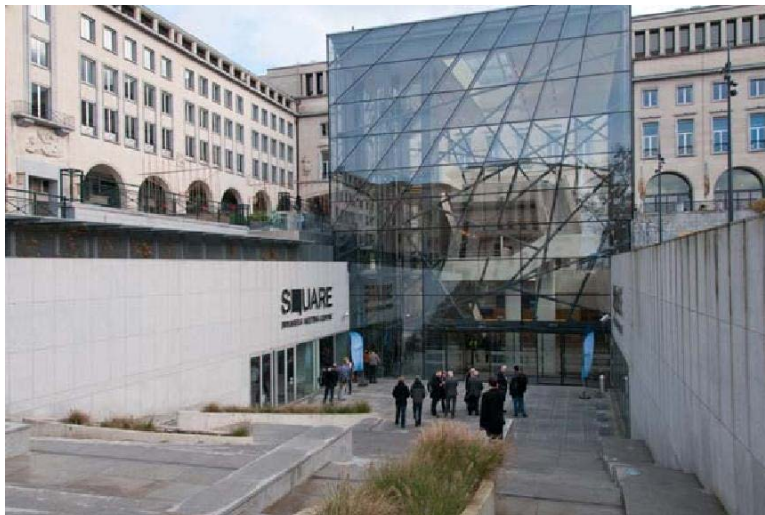
Le centre de congrès « Square » à Bruxelles, Conférence annuelle de l'ICA, 23-24 novembre

Après la réunion plénière, trois séances parallèles ont été organisées avec des présentations et des débats fort divers et intéressants. Des résumés des séances et des témoignages des participants peuvent être consultés sur le site internet de l'ICA .