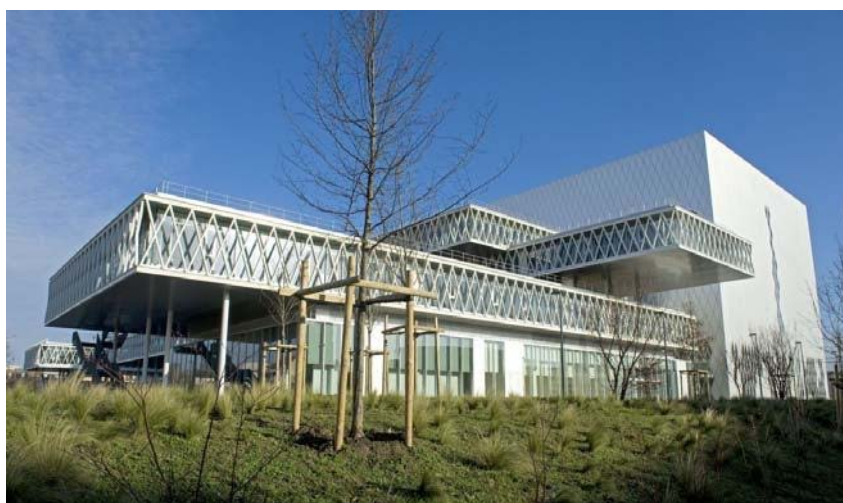
Les Archives Nationales à Pierrefitte-sur-Seine

La construction du centre des archives nationales à Pierrefitte-sur-Seine fait partie des projets d'envergure menés récemment et confiés à un cabinet d'architecte prestigieux.