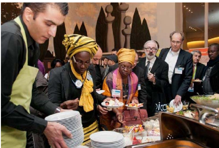
Des participants de la Conférence à l'heure du déjeuner, Bruxelles, novembre 2013

Le Forum des Archivistes Nationaux (FAN), quant à lui, s'est réuni le vendredi 22 novembre sur le site de la Bibliothèque royale de Belgique. Un résumé de la réunion est disponible sur le site internet de l'ICA . L'Assemblée générale de l'ICA a eu lieu dans l'après-midi du samedi 23 novembre au centre « Square ».