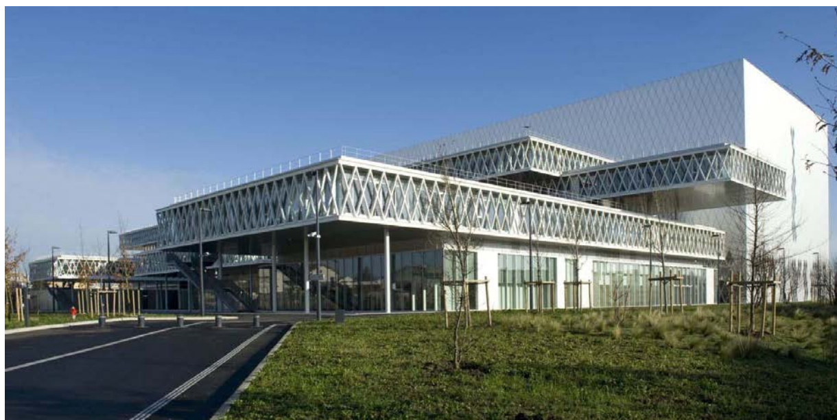
«Photo de l'année» les Archives Nationales à Pierrefitte-sur-Seine