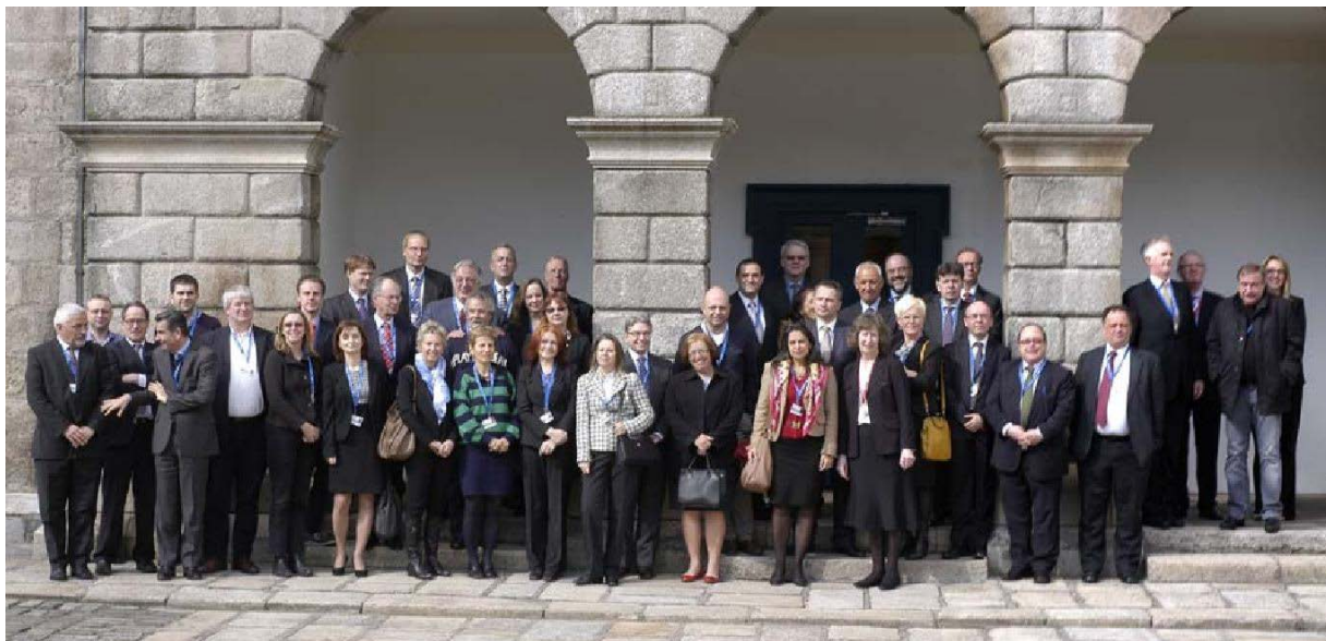
Participants de la réunion EBNA/EAG à Dublin, 2 avril 2013