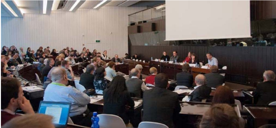
Une session de la Conférence annuelle, 24 novembre, au centre de conférences Square à Bruxelles

Pendant la séance de clôture, les participants ont demandé explicitement que les présentations et les textes soient mis le plus vite possible à la disposition du public. L'ICA s'est engagé à examiner comment il pourrait être satisfait à ce souhait. Les actes de la Conférence ne seront pas publiés en tant que tels mais COMMA, la revue de l'ICA comportera une sélection des contributions.